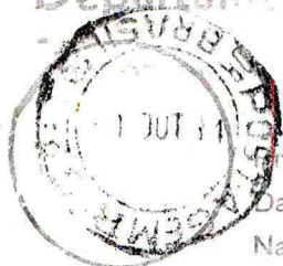
Carimbo de origem