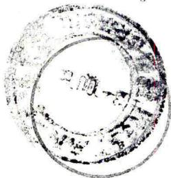
Carimbo da distribuição

Recebi o objeto registrado acima descrito.