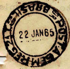
Carimbo de origem