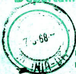
Carimbo de origem