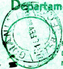
Carimbo de origem