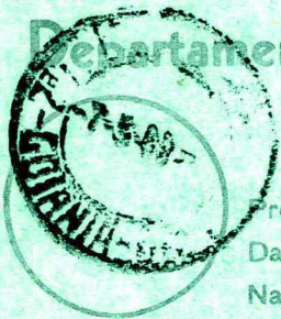
Carimbo de origem