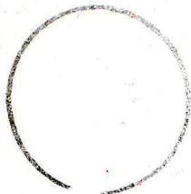
Carimbo de origem