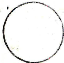
Carimbo da distribuição

Recebi o objeto registrado acima descrito.