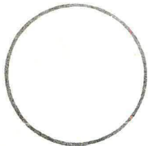
Carimbo da distribuição

Recebi o objeto registrado acima descrito.