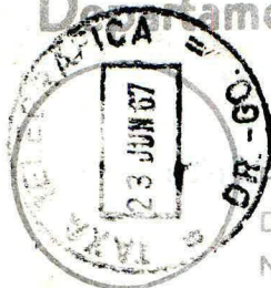
Carimbo de origem