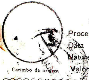
Carimbo de origem

Recebi o objeto registrado acima descrito.