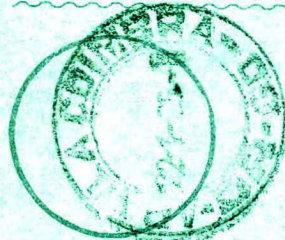
Carimbo da distribuição

Recebi o objeto registrado acima descrito.